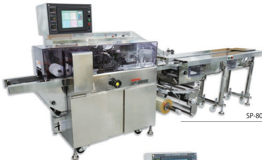
SP-803R (写真はステンレス仕様：オプション)