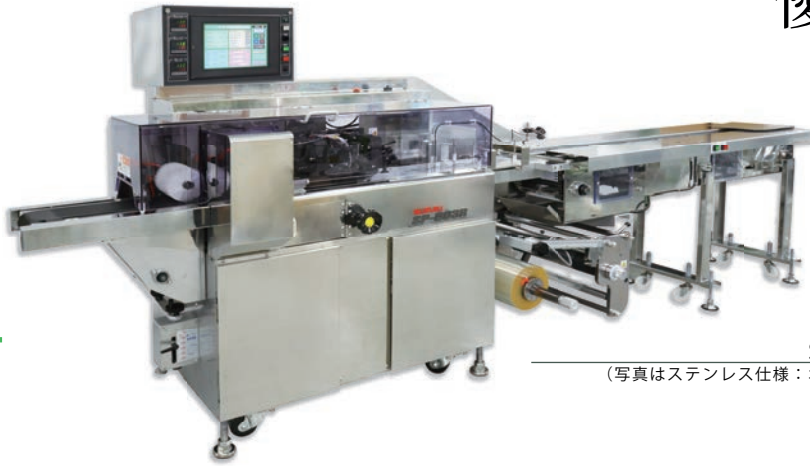
SP803R (写真はステンレス仕様：オプション)