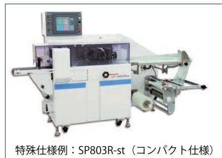
特殊仕様例：SP803R-st (コンパクト仕様)

「逆ピロー」のRシリーズでは製品投入エリアを短くしてコンパクトさを追求した「SP803R-st」や「SP803R-mt」を、「逆ピロー／直乗せ式」のRonシリーズではカットピッチ(袋長さ)が比較的長めの「小ネギ」や「ニラ」の高速包装を行う「SP803RonL」をご用意し、お客様のニーズに応じた特殊仕様をご提案いたします。