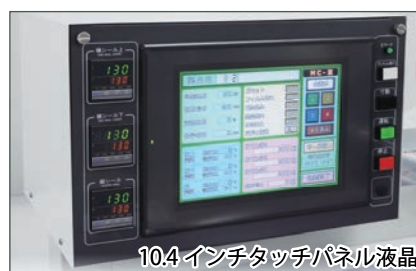
10.4 インチタッチパネル液晶